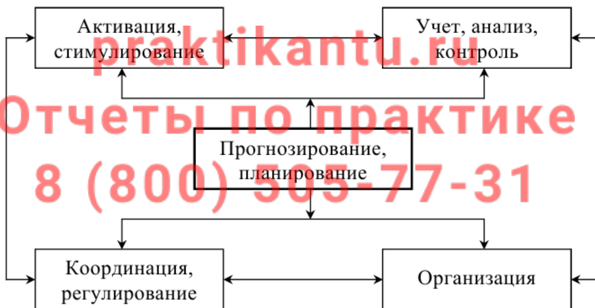
Рисунок 3.1 – Связь прогнозирования и планирования с другими функциями управления

Процесс государственного регулирования экономики включает в себя реализацию многих функций. В их число входят прогнозирование и планирование, организация, координация и регулирование, учет, контроль и анализ, активация и стимулирование (рисунок 3.1).