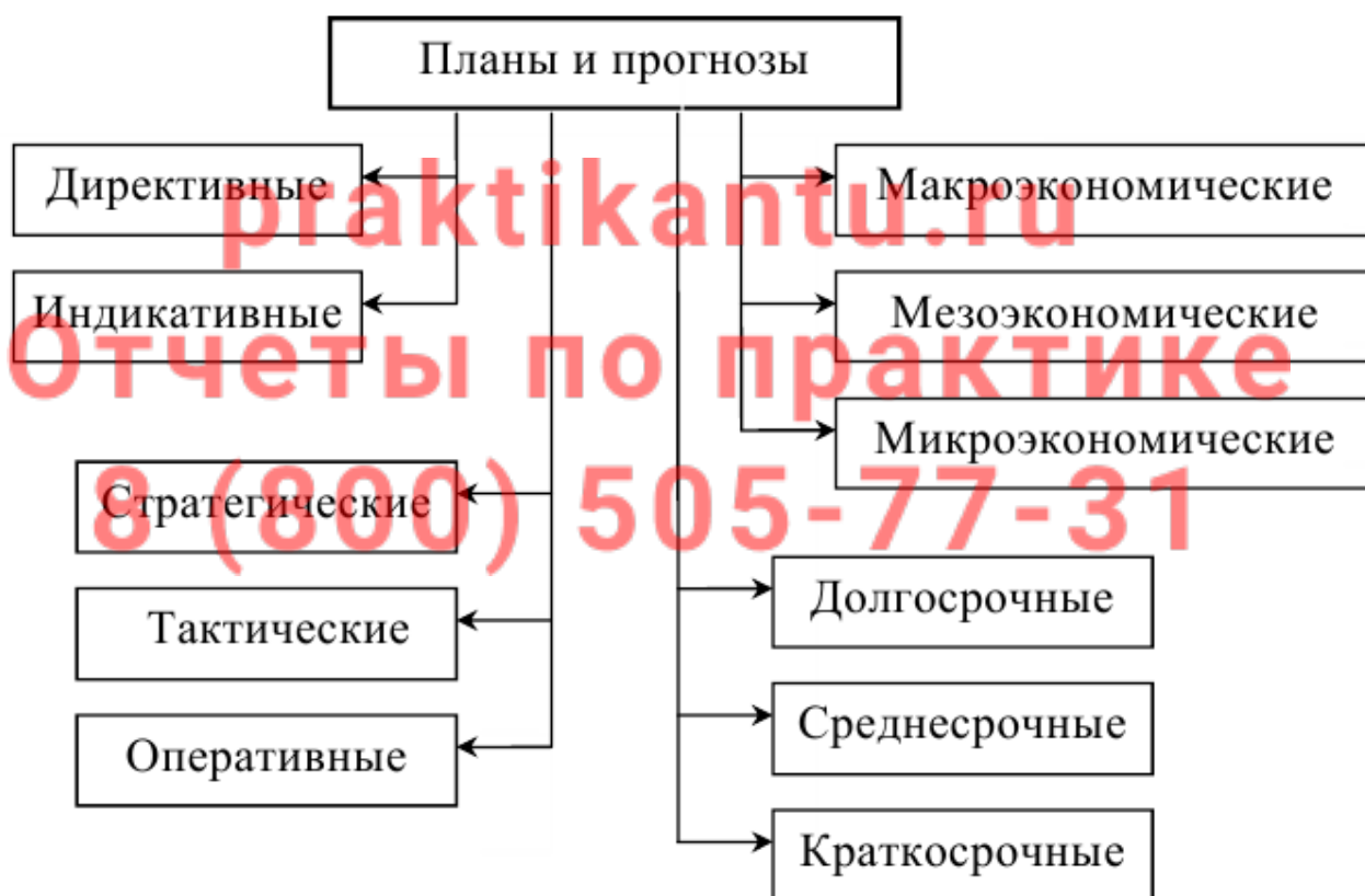
Рисунок 3.2 – Общая классификация форм планирования и видов планов и прогнозов

Виды планов и прогнозов в соответствии с указанными выше критериями их классификации представлены на рисунке 3.2.