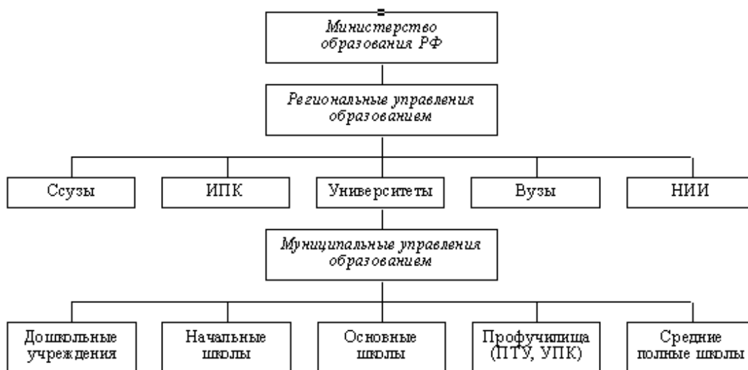
Рис. 1.2 – Система высшего образования РФ

Как видно из рисунка 1.2, высшие учебные заведения являются частью системы образования РФ, поэтому Дальневосточный институт управления – филиал федерального государственного бюджетного образовательного учреждения высшего профессионального образования «Российская академия народного хозяйства и государственной службы при Президенте Российской Федерации» является частью данной системы. В Приложении 1 показаны рейтинги РАНХиГС. Можно отметить, что РАНХиГС стала одним из самых востребованных вузов в сфере управления (15 декабря 2017 г.). Также примечательным фактом является то, что выпускники ФФБ РАНХиГС – одни из самых востребованных в сфере экономики и финансов (14 декабря 2017 г.). Академия вошла в список 90 лучших вузов стран БРИКС (23 ноября 2017 г.).