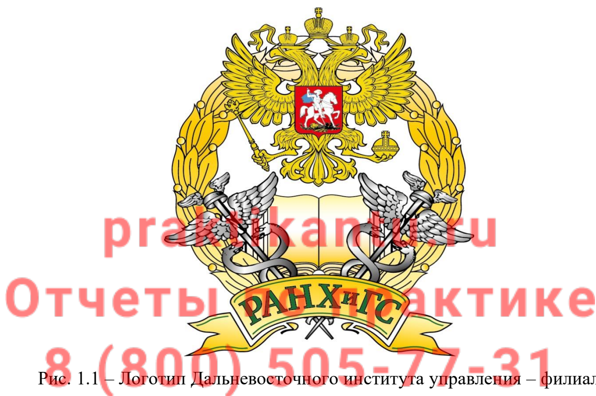
Рис. 1.1 – Логотип Дальневосточного института управления – филиал федерального государственного бюджетного образовательного учреждения высшего профессионального образования «Российская академия народного хозяйства и государственной службы при Президенте Российской Федерации»

Логотип Дальневосточного института управления – филиала федерального государственного бюджетного образовательного учреждения высшего профессионального образования «Российская академия народного хозяйства и государственной службы при Президенте Российской Федерации» показан на рисунке 1.1.